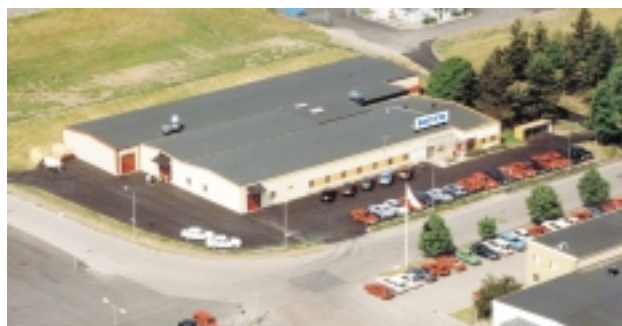
NOTE i Skänninge, en av de två produktionsanläggningar som förvärvades i december.

Företagets optionsprogram kommer maximalt att öka antalet aktier med 24 000 st, motsvarande 6,0 %, vilket också har beaktats i ovanstående beräkning.